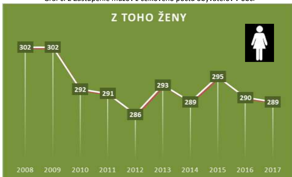
Graf č. 3 Zastúpenie žien z celkového počtu obyvateľov v obci

S vývojom počtu obyvateľov súvisí aj vývoj prirodzeného prírastku a migračného salda obyvateľstva obce. Počas rokov 2008 až 2017 sa tieto ukazovatele vyvíjali nasledovne: