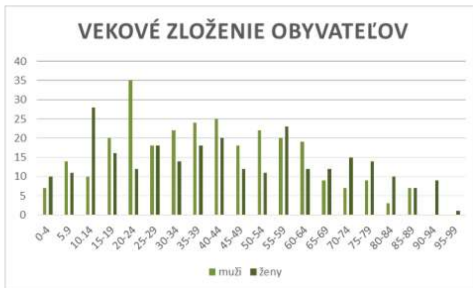
Graf č. 8 Veková štruktúra obyvateľstva k 31. 12. 2017

Tabuľka č. 6 a Graf č. 8 znázorňujú štruktúru obyvateľstva podľa vekových skupín a súčasne podľa pohlavia, pričom jednotlivé skupiny mužov a žien sú vyčlenené v intervaloch po 5 rokoch.