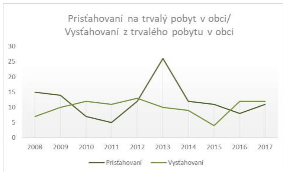
Graf č. 5 Prisťahovaní a vystáňovaní v obci