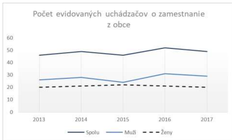
Graf č. 9 Počet evidovaných uchádzačov o zamestnanie k 31.12.2017

Za sledované obdobie zaznamenávame v obci mierny nárast evidovaných uchádzačov o zamestnanie hlavne z radov mužov. U žien sa situácia za obdobie posledných piatich rokov situácia nemení. Najvyšší počet evidovaných nezamestnaných z obce bol v roku 2016 (52 uchádzačov).