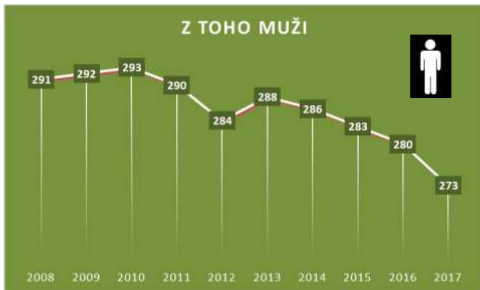
Graf č. 2 Zastúpenie mužov z celkového počtu obyvateľov v obci