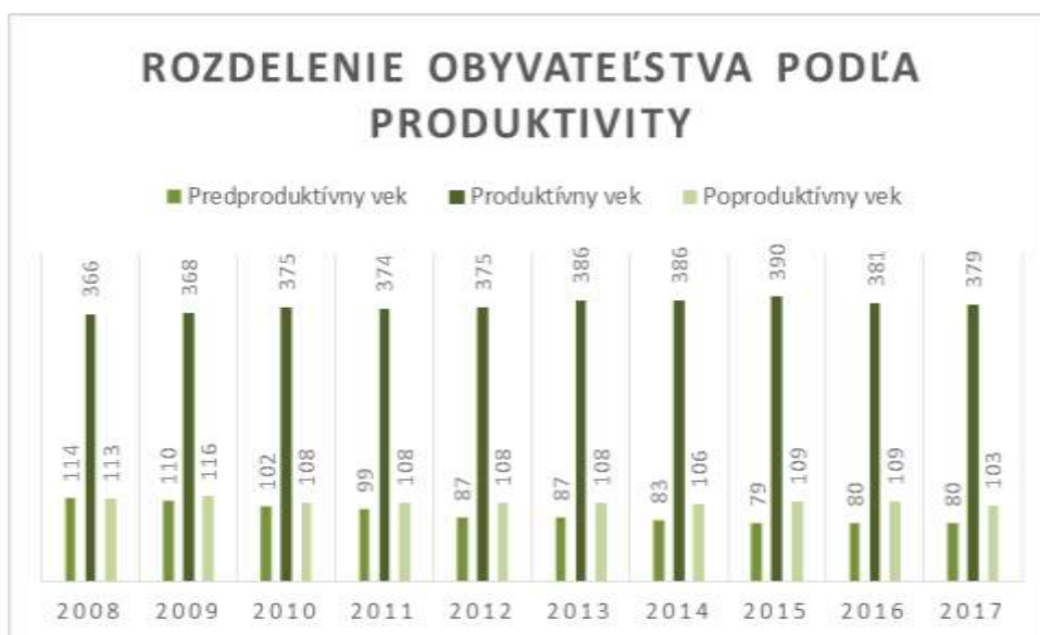
Graf č. 7 Vývoj obyvateľstva podľa produktivity v obci za sledované obdobie

Podľa posledného štatistického údaju k 31.12.2017 z celkového počtu obyvateľov obce je v produktívnom veku (15-64) 67,43 % obyvateľov. Druhou najväčšou skupinou obyvateľstva je skupina obyvateľov od 65 rokov a viac s 18,32 %. Najmenej početnou je skupina detí od 0-14 rokov, ktorá tvorí 14,23 % obyvateľstva.