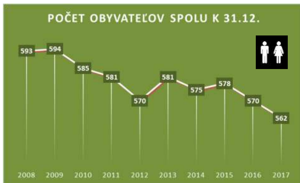
Graf č. 1 Vývoj počtu obyvateľov v obci

K 31.12.2017 bolo zastúpenie žien z celkového počtu obyvateľov 48,57 % (273) a mužov 51,43 % (289). Za sledované obdobie okrem roku 2010 bol v obci vždy väčší počet mužov ako žien.