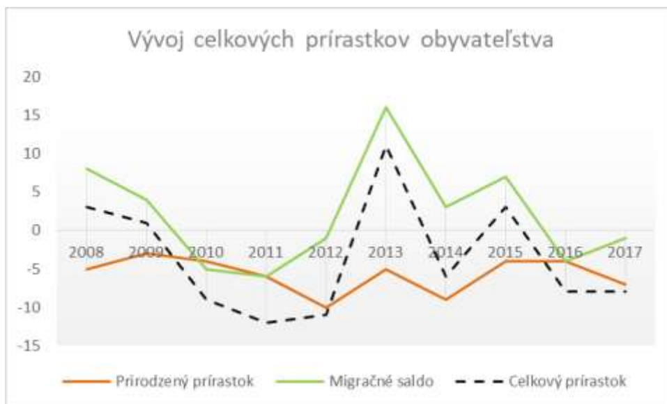
Graf č. 6 Vývoj prírastkov obyvateľstva v obci za sledované obdobie

Podľa posledného štatistického údaju k 31.12.2017 z celkového počtu obyvateľov obce je v produktívnom veku (15-64) 67,43 % obyvateľov. Druhou najväčšou skupinou obyvateľstva je skupina obyvateľov od 65 rokov a viac s 18,32 %. Najmenej početnou je skupina detí od 0-14 rokov, ktorá tvorí 14,23 % obyvateľstva.