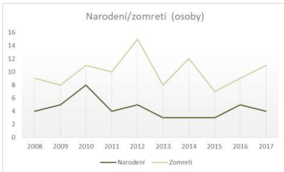
Graf č. 4 Narodení/zomretí v obci